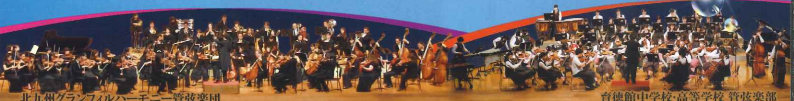
北九州グランフィルハーモニー管弦楽団