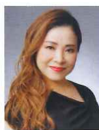
並河寿美 Hisami NAMIKAWA

故レナード・バーンスタイン、小澤征爾らに師事。1989年ブザンソン国際指揮者コンクール優勝。これまでパリ管弦楽団、ベルリン・フィルハーモニー管弦楽団等欧州の一流オーケストラを多数指揮。現在オーストリアのトーンクンストラ管弦楽団音楽監督、兵庫県立芸術文化センター芸術監督、シエナ・ウインド・オーケストラの首席指揮者を務める。著書に「僕はいかにして指揮者になったのか」(新潮文庫)など。2023年4月より新日本フィルハーモニー交響楽団音楽監督に就任。オフィシャルファンサイト： http://yutaka-sado.meetsfan.jp