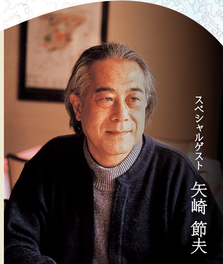
スペシャルゲスト 矢崎節夫